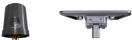
65×155° (Type II-M)

שינוי עוצמות הארה, קביעת זמני הארה, התראות על מצב סוללה/ תקלות בזמן אמת ויצירת דוחות סטטיסטיים מלאים.